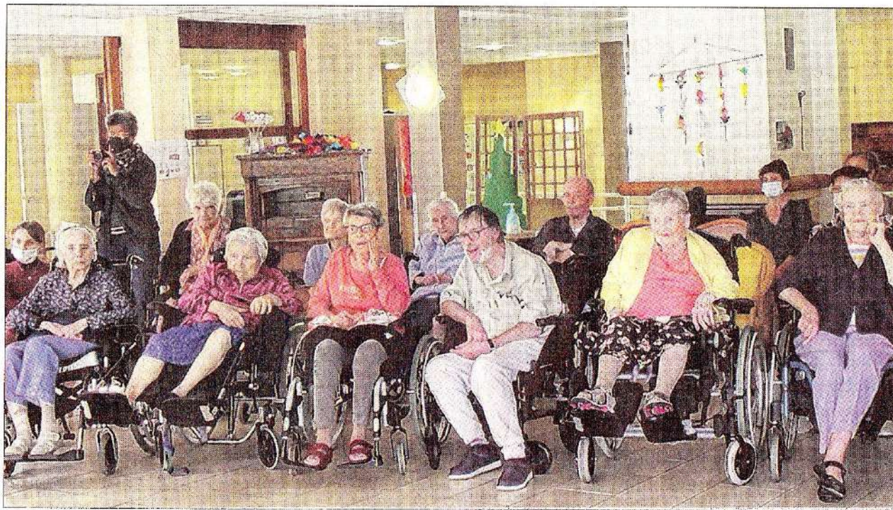
Les résidents de la Maison Cauzid étaient enchantés de ce spectacle.

Après la prestation, les questions ont fusé sur l'origine des instruments et sur l'inspiration de la danse. C'est dans la joie du partage d'un goûter que s'est terminé cet après-midi récréatif. Le 2 octobre se tiendra la grande fête annuelle de l'amitié tant attendue par tous car annulée pour crise Covid pendant deux ans d'affilée.